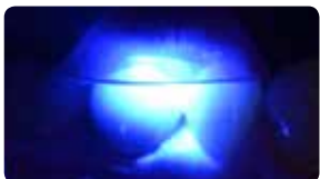
Гумова консистенція досягається лише за 3 секунди преполімеризації