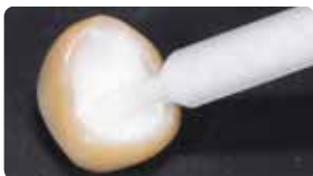
Дозування з автоматичною насадкою