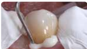
Легке видалення надлишків одним рухом