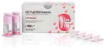
GC FujiCEM Automix