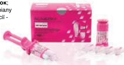
GC FujiCEM 2 Automix

На сьогодні надійність GC FujiCEM підтвержується десятилітнім досвідом його успішного використання у всьому світі для фіксації більш ніж 150 мільйонів коронок ; наступним етапом розвитку цього матеріалу стала розробка його удосконаленої версії - GC FujiCEM 2 .